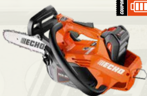
DCS-3000T Motosega a batteria

Tensione max (V): 56 Lunghezza barra (pollici): 12 Peso a secco (Kg): 3