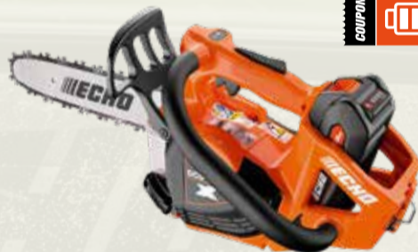
DCS-3500T Motosega a batteria

Tensione max (V): 56 Lunghezza barra (pollici): 14 Peso a secco (Kg): 2.2