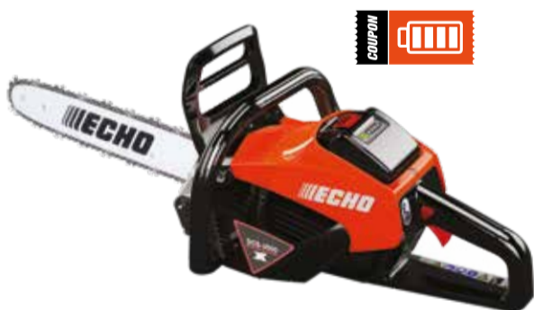
DCS-3500 Motosega a batteria

Tensione max (V): 56 Lunghezza barra (pollici): 14 Peso a secco (Kg): 2.9