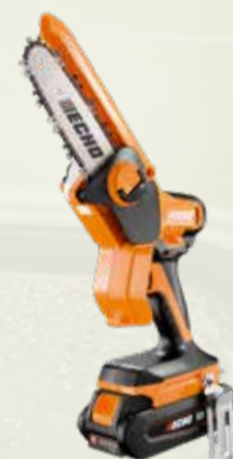
DHS-3006 Potatore a mano a batteria

Tensione max (V): 56 Lunghezza barra (pollici): 6 Peso a secco (Kg): 1.2