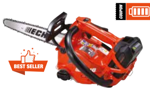
DCS-2500T Motosega a batteria

Tensione max (V): 56 Lunghezza barra (pollici): 8 Peso a secco (Kg): 1.6