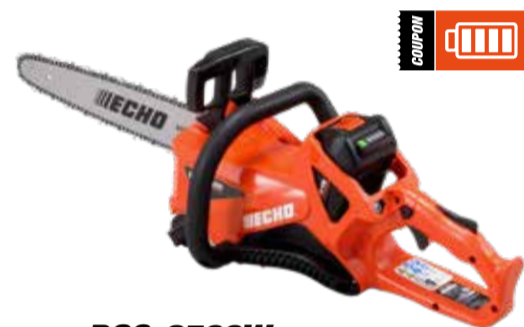
DCS-2500W Motosega a batteria

Tensione max (V): 56 Lunghezza barra (pollici): 10 Peso a secco (Kg): 2.0