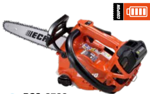
DCS-2500 Motosega a batteria

Tensione max (V): 56 Lunghezza barra (pollici): 10 Peso a secco (Kg): 1.6